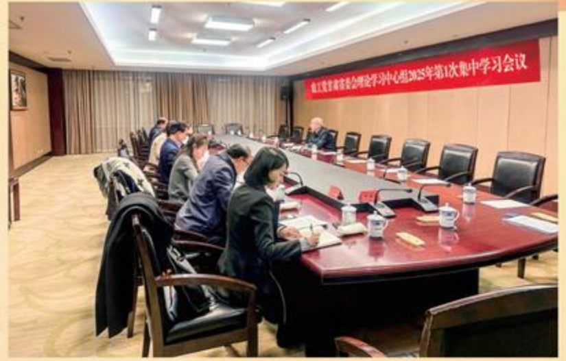
2月19日,农工党甘肃省委会理论学习中心组召开2025年第1次集中学习会议