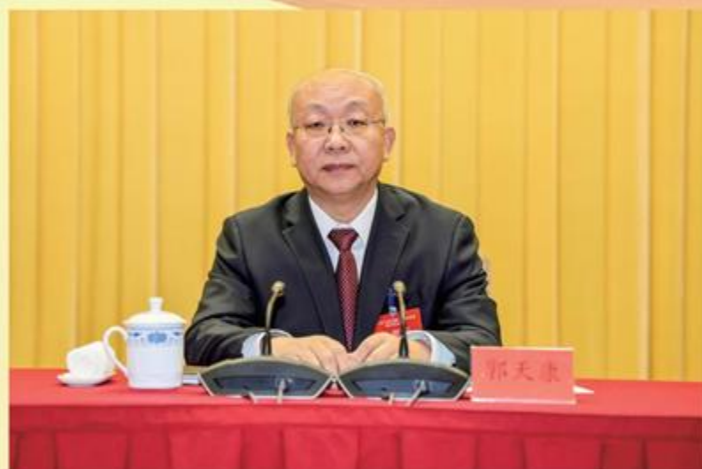
甘肃省政协副主席、农工党甘肃省委会主委郭天康出席并作工作报告