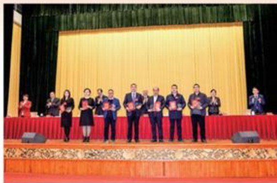
通报表扬 2023-2024 年度工作成绩突出的集体和个人