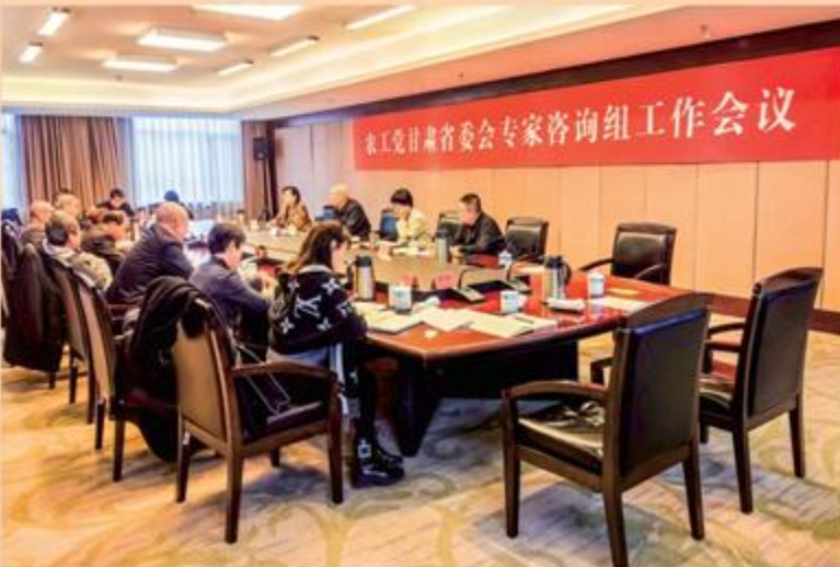
2月19日,农工党甘肃省委会专家咨询组工作会议在兰州召开