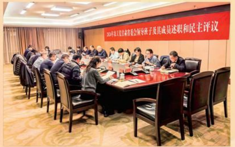
2月19日,2024年度农工党甘肃省委会领导班子和班子成员述职和民主评议会议在兰州召开