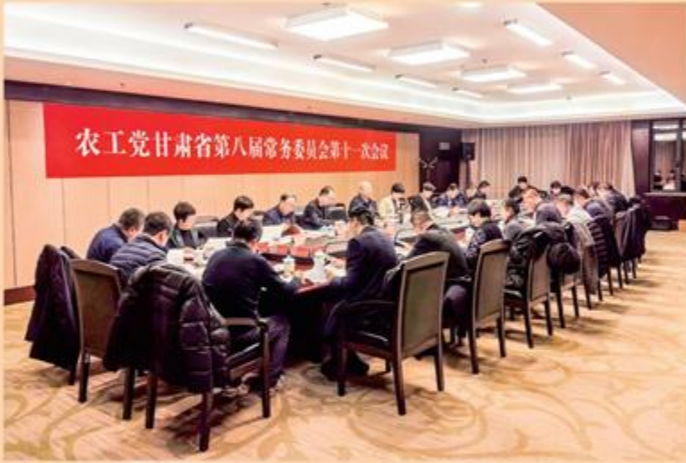
2月19日,农工党甘肃省第八届常务委员会第十一次会议在兰州召开