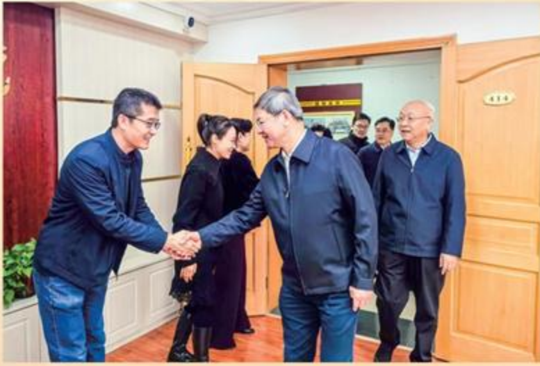
2月7日,省政协主席庄国泰走访农工党甘肃省委会机关,向机关干部致以诚挚问候和新春祝福,并听取对政协工作的意见建议