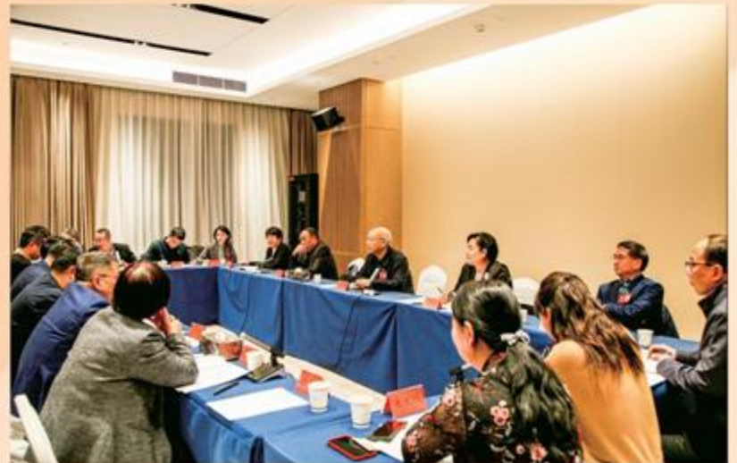
1月20日,农工党甘肃省委会召开省人大代表和政协委员履职经验交流座谈会