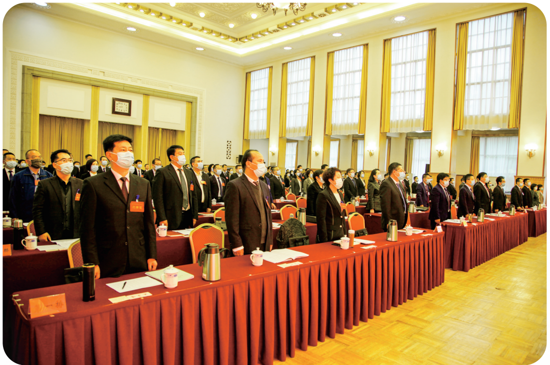
开幕大会奏唱国歌